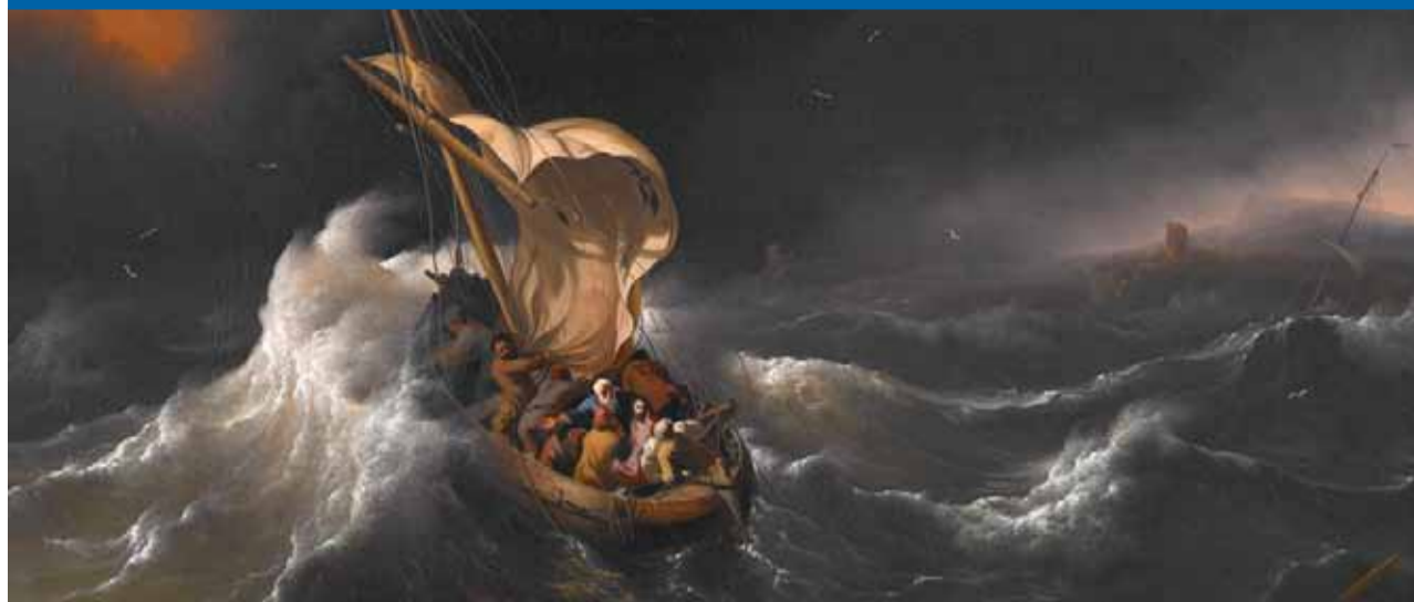
Ludolf Backhuysen, Seesturm, 1695